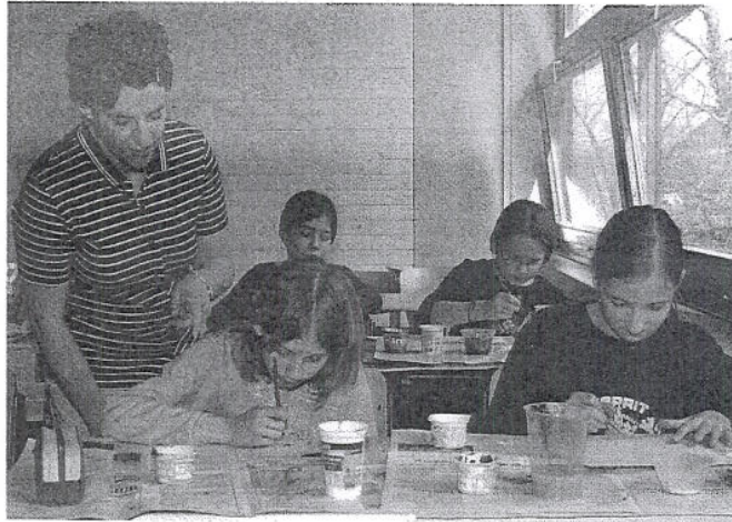
Auch die größeren Kinder haben Zeit für Aktivitäten in der Schule – Nachmittagsbetreuung am Johannes-Kepler-Gymnasium

Dabei sind die Schulfördervereine nicht allein gelassen. Sie erhalten von der Stadt Reutlingen über die finanziellen Zuschüsse hinaus eine kompetente Beratung sowie Sachhilfen in