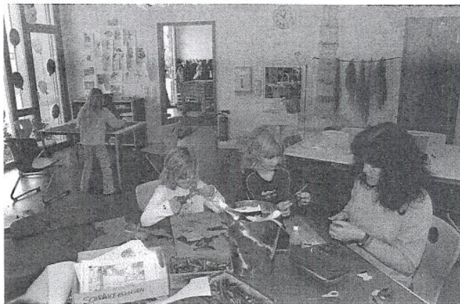
Bastelangebot der Ganztagsbetreuung in der Grundschule Rommelsbach

Die Weiterentwicklung der Reutlinger Schulen ist aber nicht abgeschlossen. Ab dem Schuljahr 2008/2009 werden 7 weitere Ganztagsgrundschulen („Schulen mit besonderer pädagogischer und sozialer Aufgabenstellung“), davon 3 als offene und 4 in teilgebundener Form im Zuge der Reutlinger Familienoffensive eingerichtet. Diese Ganztagschulen erhalten durch das Land zusätzliche Lehrerdeputate, haben ein an 4 Tagen jeweils mindestens die Zeit von 8 bis 15 Uhr